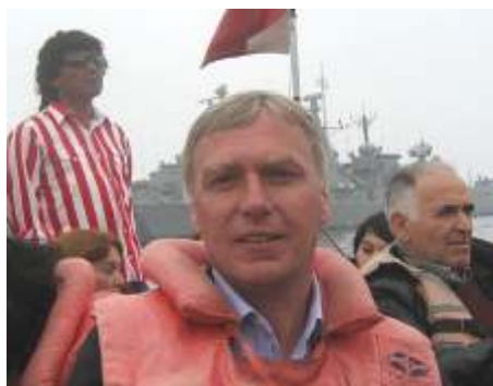
Der Obmann beim Versuch, nach den in der Karibik versenkten Milliarden eines (anderen) Großvereines ;-) zu tauchen ;-).

Schon oft herbei gesehnt, aber bis jetzt noch nicht erfüllt: Die AVG-Nachrichten in Farbe!